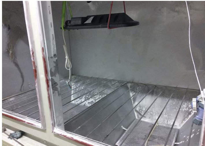
Cámara de Polvo